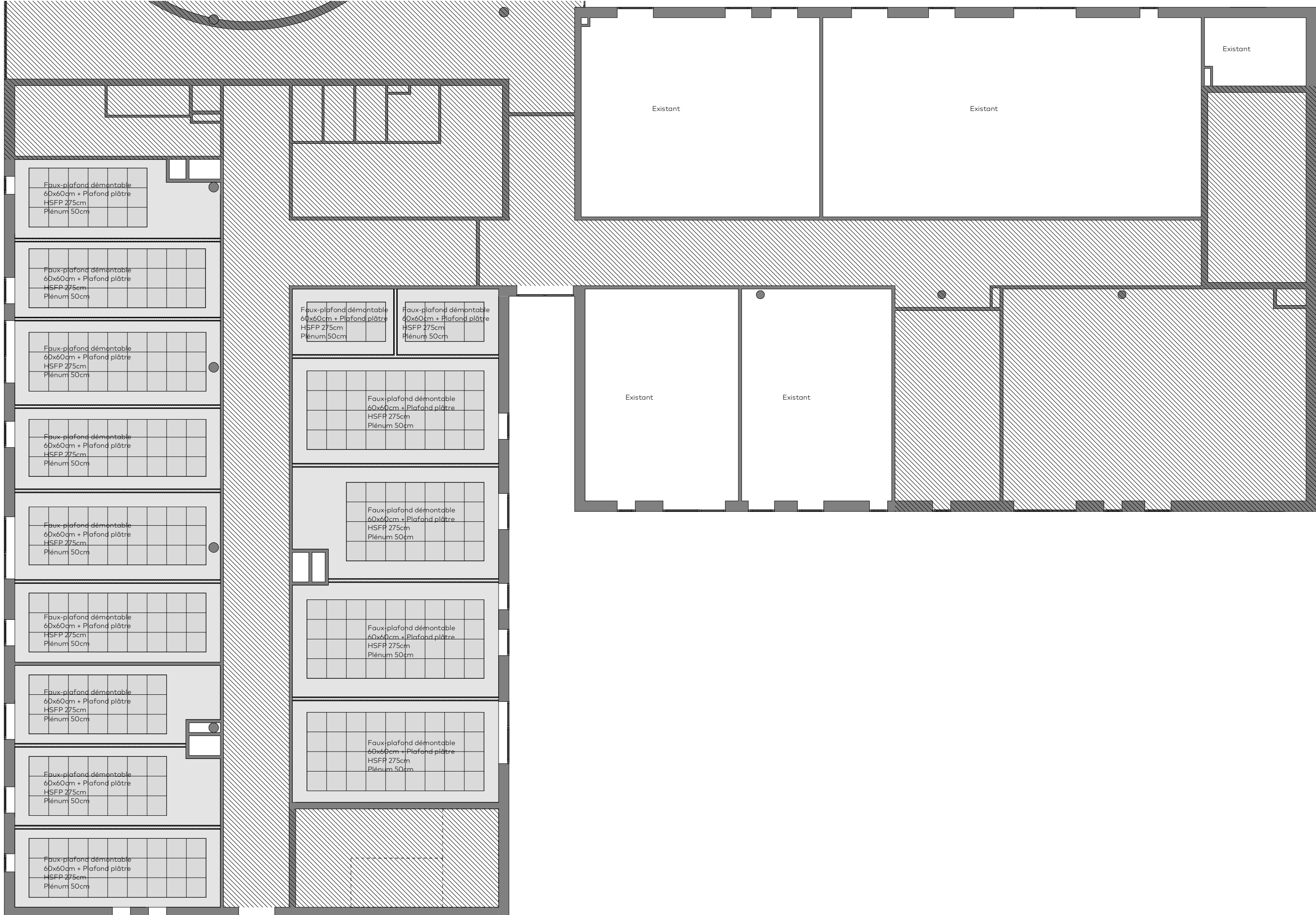
Existant - R+1